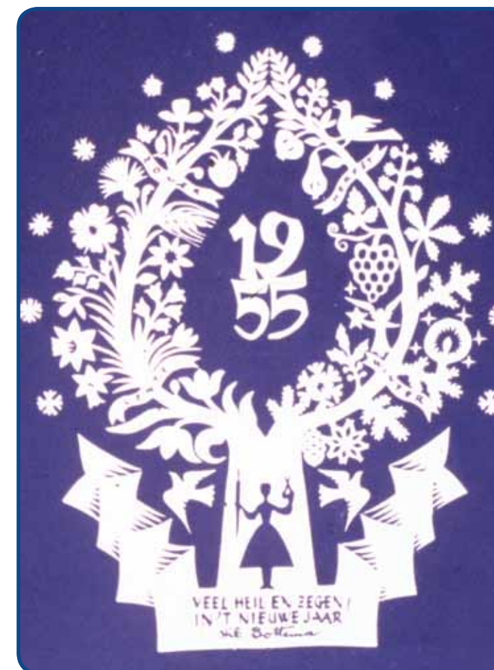
Hil Bottema: Nieuwjaarskaart.